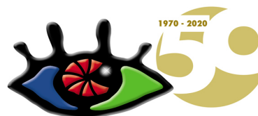
Agrupación Fotográfica de La Rioja