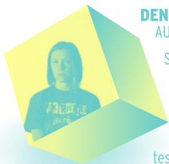
DENISA SZIDORAK ◆ FOTOGRAFÍA AUR

Sobre una serie de fotografías en blanco y negro tomadas en entornos naturales, la autora ha pintado de dorado algunos de los detalles presentes en las imágenes (árboles, ramas, calaveras animales encontradas) para resaltar la importancia de la naturaleza y presentarla como un tesoro, algo precioso que nos urge preservar.